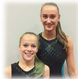
Amber & Lotus